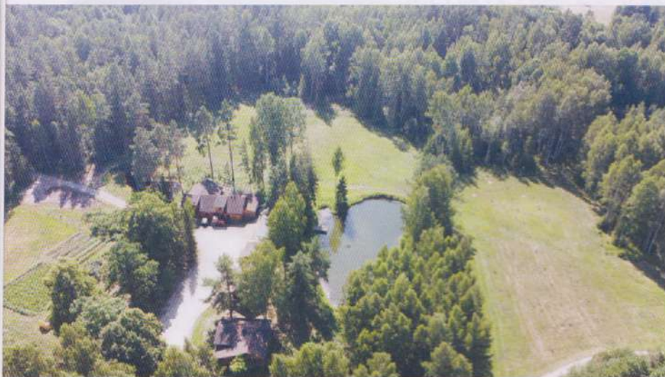
Bukmeķi no putna lidojuma.

tam sievišķie ziedi vai otrādi. Teiksim tā – ja tie ir pāris koki, viss lielā mērā notiks pats no sevis, ja vēlaties lielāku audzi, tad jau ir jāpēta – kāda ir augsne, gruntsūdeņi, vēju virziens – var veidot, piemēram, bērzu rindu, kas aiztur vējus, rūpīgi jāizvēlas šķirne.